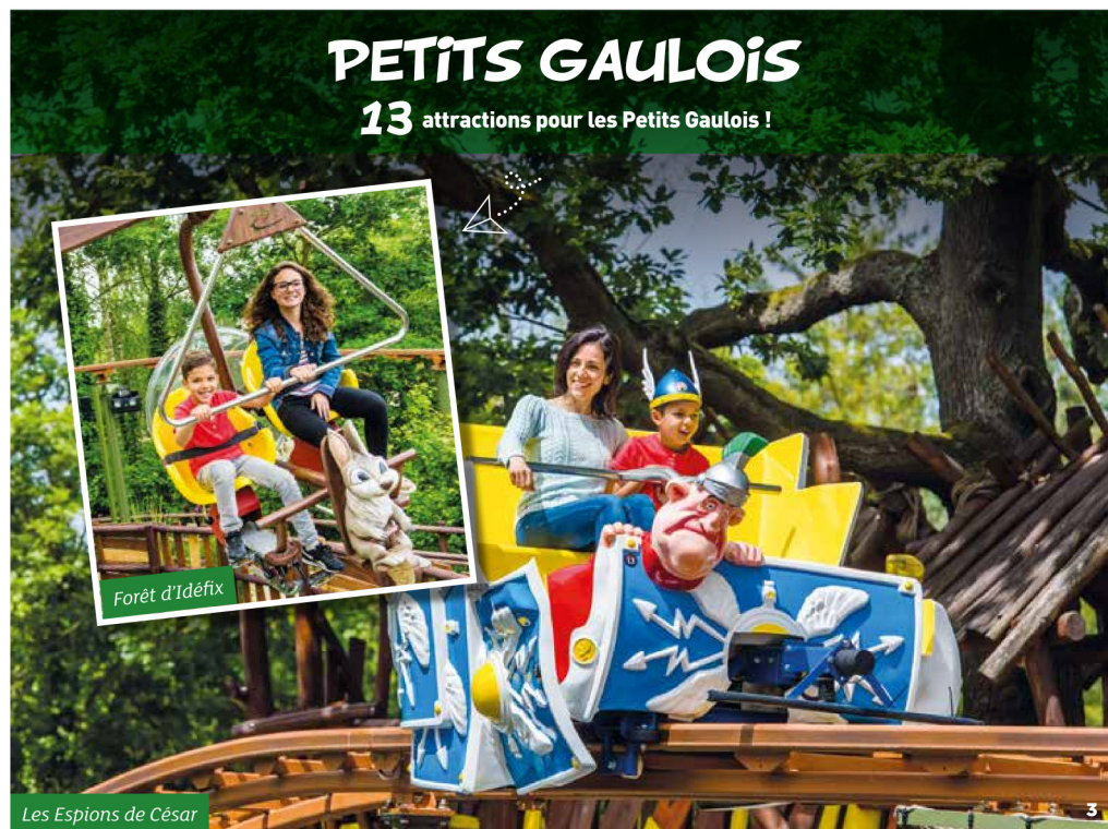
Les Espions de César