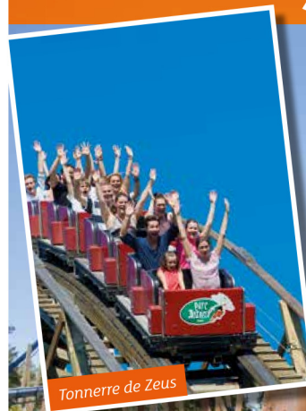
Tonnerre de Zeus

7 attractions pour les plus téméraires !