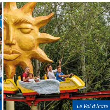
Le Vol d'Icare